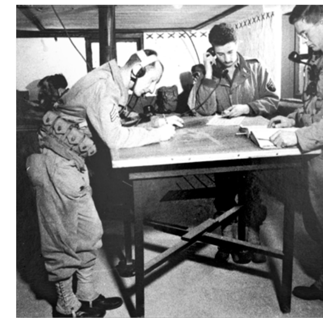
▲ Hermenn í Skeleton Hill 1942. 167927.