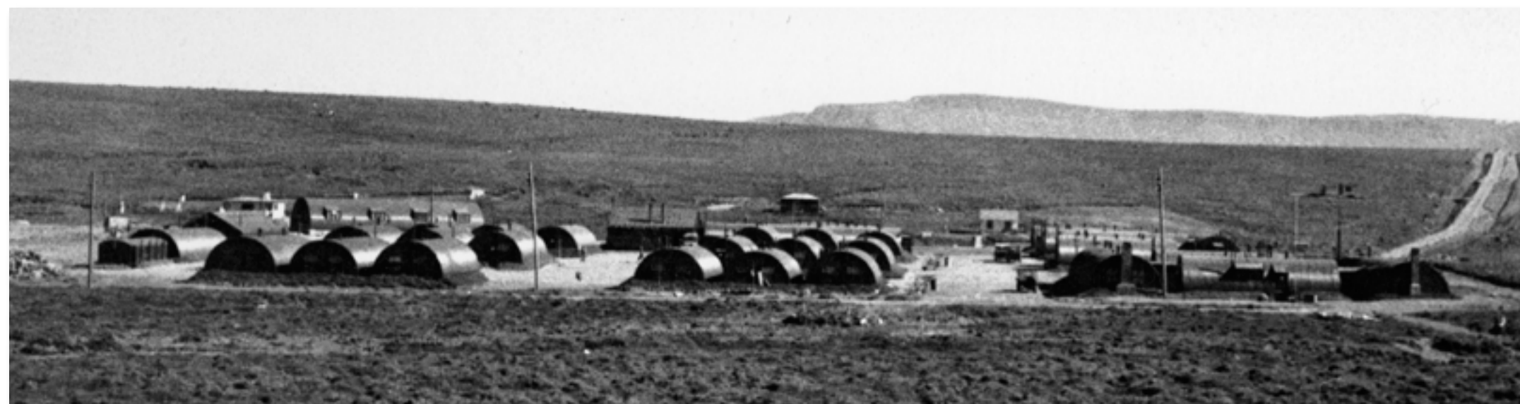
Hilton Camp í landi Fífuhvams árið 1942. Ljósmynd Bandaríski herinn, 14772-R.

Þjóðverjar gáfust upp 8. maí 1945 og styrjöldinni lauk í Evrópu. Bandaríkjamenn vildu þó hafa herstöð áfram og yfirgáfu síðustu hermennirnir Ísland ekki fyrr en 8. apríl 1947 í samræmi við Keflavíkursamninginn. Árið 1951, tveimur árum eftir að Ísland gekk í NATO, var gerður umdeildur samningur við Bandaríkjamenn um hvernd landsins sem stóð til 2006.